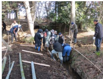
白松杭と竹を使用した竹柵設置(27 年 2 月)