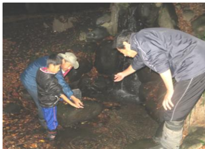
カワニナ放流(27 年 11 月)