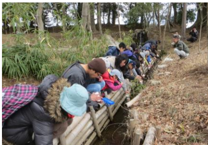
ホタルの幼虫を放流(29 年 4 月 1 日)