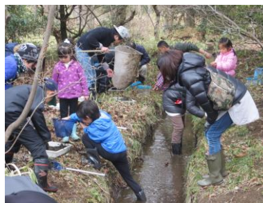
ホタルの生息地で幼虫捕獲(29 年 4 月 1 日)